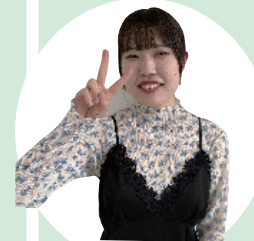
迫 京都 RAY+beauty 浜町中央橋店 ハリウッドワールド美容専門学校出身